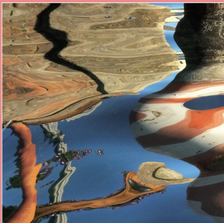
Linee Fluttuanti Fotografia digitale 50x50