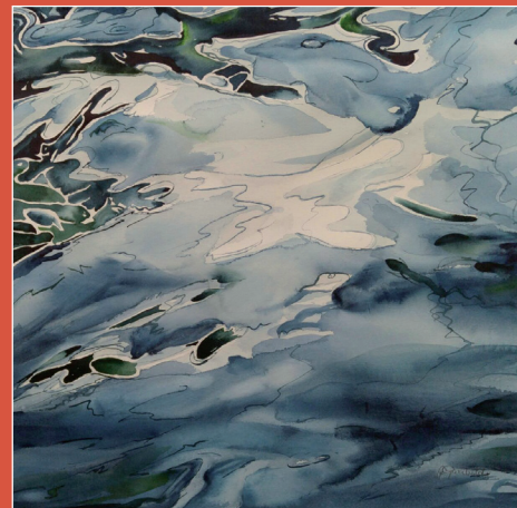
Fulvia Gariboldi Giochi di colore nell'acqua Acquerello su carta 50x50