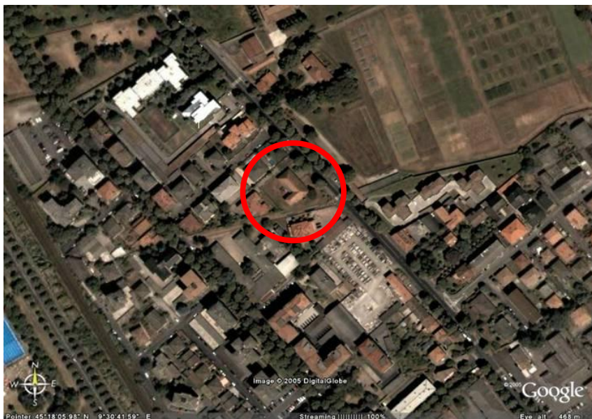
Fotografia aerea dell'area