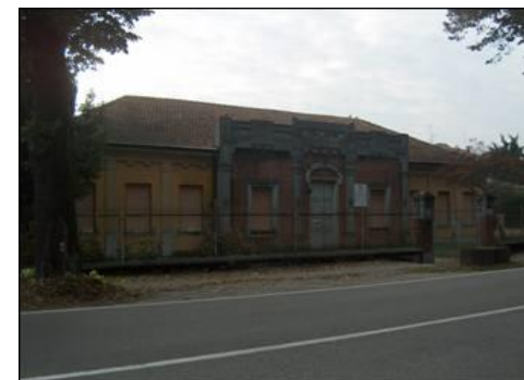
Foto edifici e/o posizione punti di misura