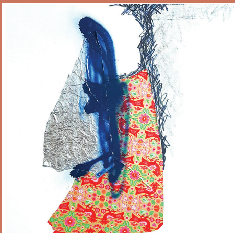
Street blue Tecnica mista su tela 50x50