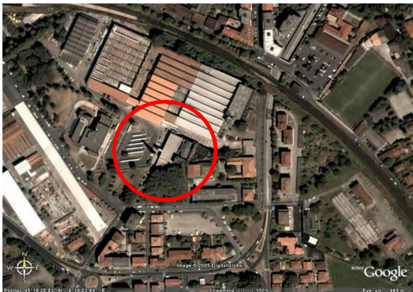
Fotografia aerea dell'area