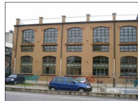
Foto edifici e/o posizione punti di misura