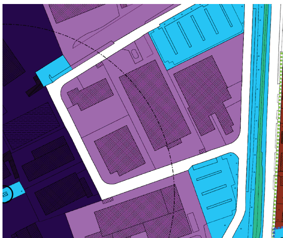
estratto di PGT - piano delle regole