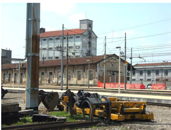
Stazione - consorzio agricolo