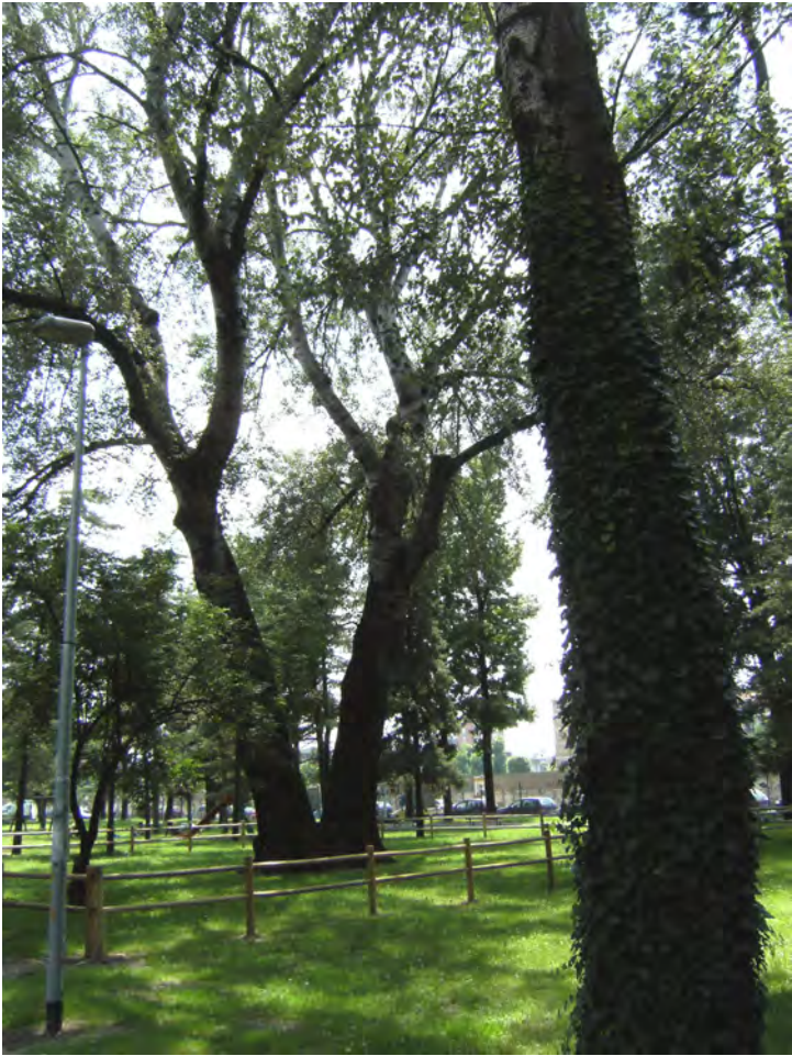
Parco via Fascetti