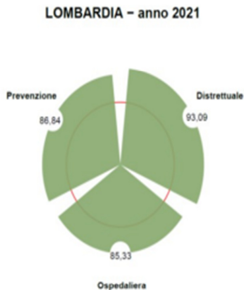
Figura 5. Risultati NSG 2021 - Regione Lombardia: punteggi complessivi CORE, per area

La valutazione finale dell'area Prevenzione collettiva e sanità pubblica per il 2021 si attesta su un punteggio pari a 86,84, che secondo l'intervallo di riferimento (esito positivo nel range 60-100) risulta sopra la soglia di adempienza. Tuttavia, si segnalano delle criticità per l'indicatore P15C - Proporzione di persone che hanno effettuato test di screening di primo livello, in un programma organizzato per mammella, cervice uterina e colon retto. L'area Distrettuale per il 2021 si attesta un punteggio pari a 93,09, secondo l'intervallo di riferimento (esito positivo nel range 60-100) risulta ampiamente sopra la soglia di adempienza. La valutazione finale dell'area Ospedaliera per il 2021 si attesta su un punteggio pari a 85,33, che secondo l'intervallo di riferimento (esito positivo nel range 60-100) risulta sopra la soglia di adempienza.