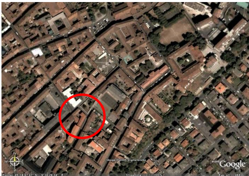
Fotografia aerea dell'area