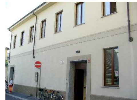
Foto edifici e/o posizione punti di misura