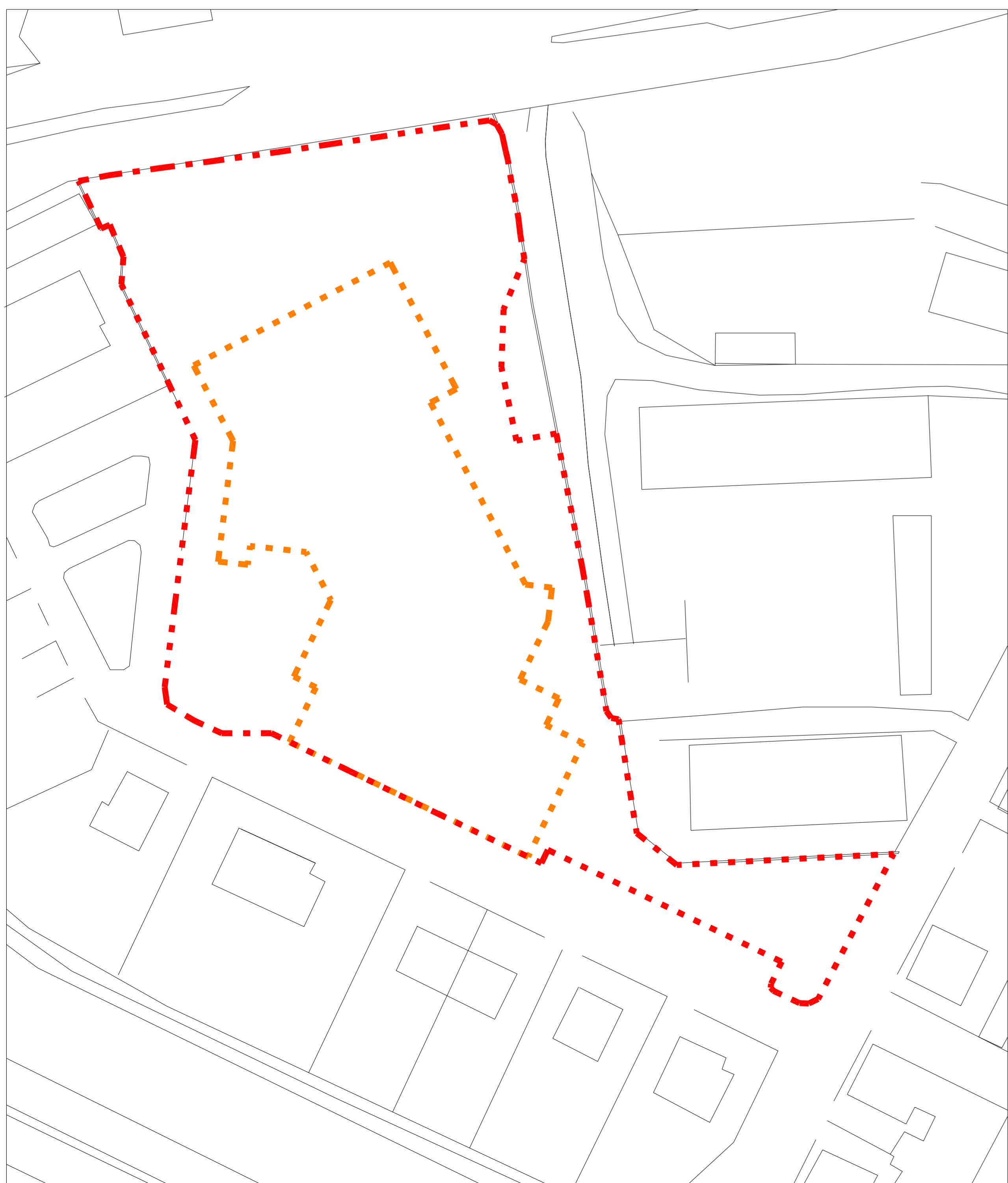
Perimetro proprietà ALER - Variante al P.I.I. approvato