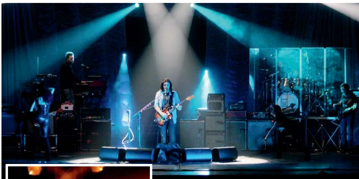
Gianluca Grignani ieri sera in concerto