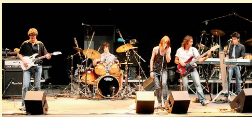
I Gardeners tornano a esibirsi dal vivo: l'appuntamento è per stasera (ore 21) al Filo