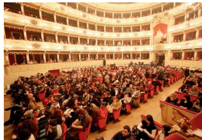
Il pubblico ha accolto con entusiasmo l'artista