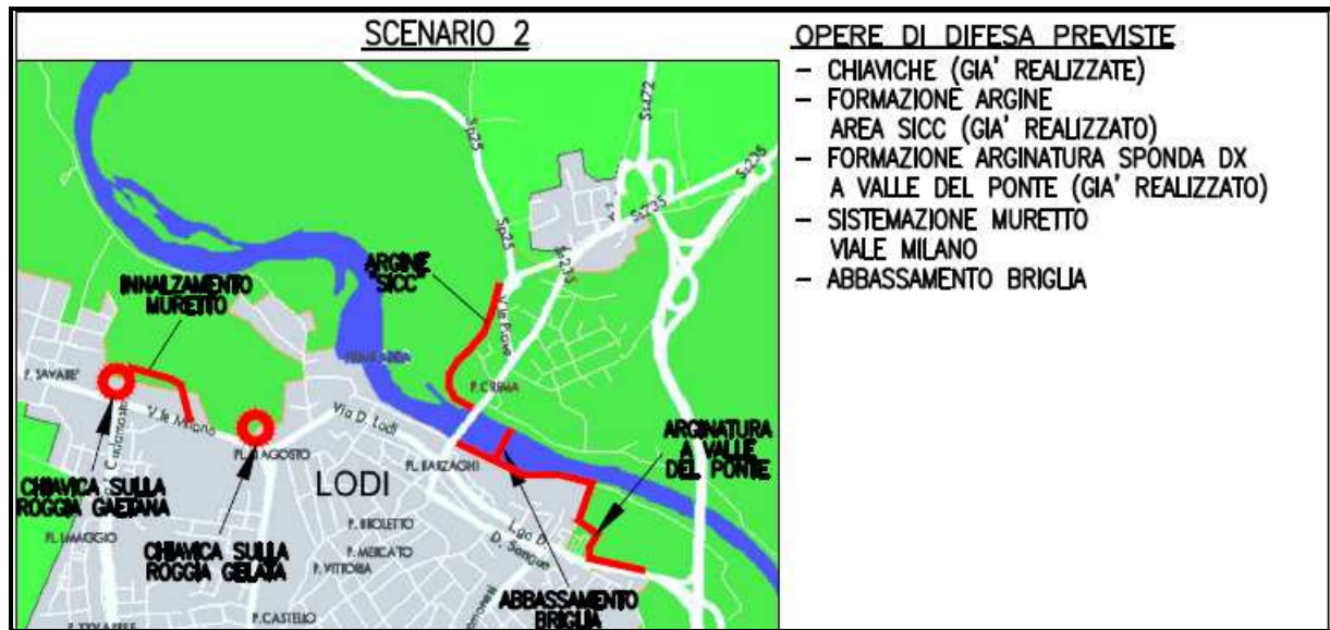
Figura 1 - Opere di difesa, scenario attuale

A seguito della realizzazione di tali opere, viene considerevolmente ridotto il grado di rischio idraulico a carico di porzioni consistenti del territorio comunale.