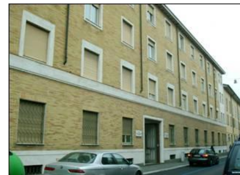
Foto edifici e/o posizione punti di misura