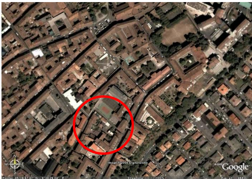
Fotografia aerea dell'area