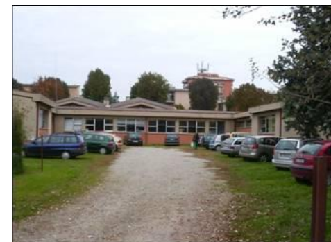
Foto edifici e/o posizione punti di misura