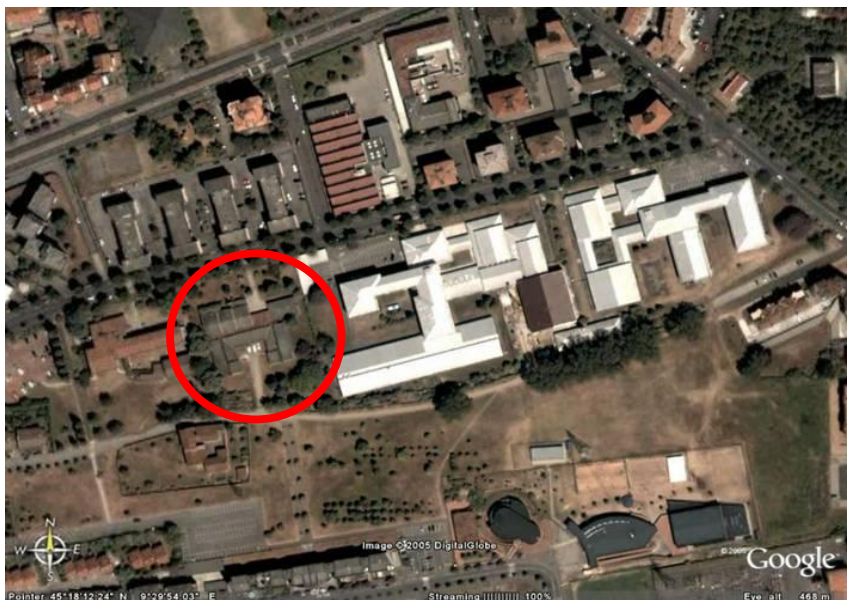
Fotografia aerea dell'area