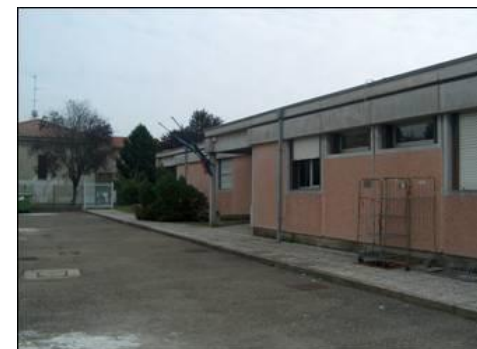
Foto edifici e/o posizione punti di misura