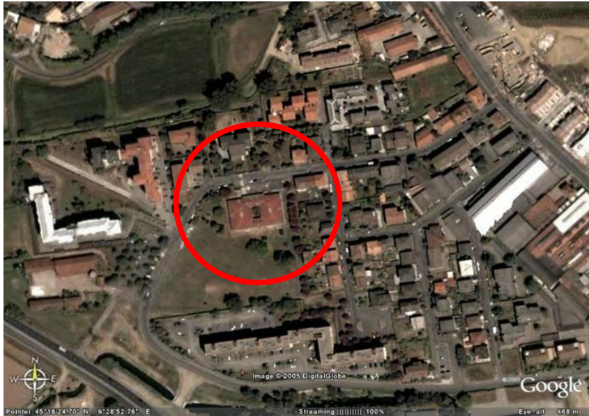
Fotografia aerea dell'area