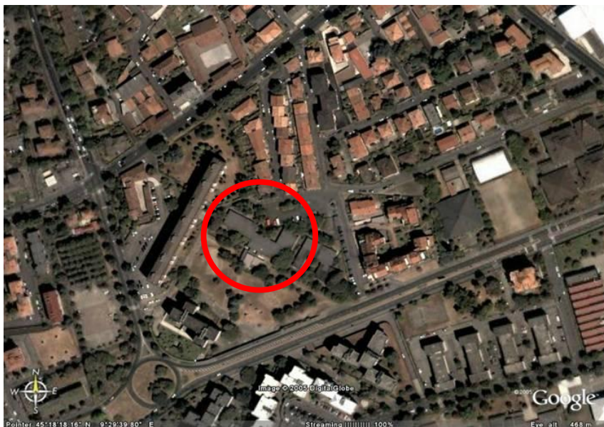
Fotografia aerea dell'area