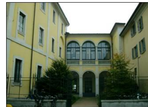
Foto edifici e/o posizione punti di misura