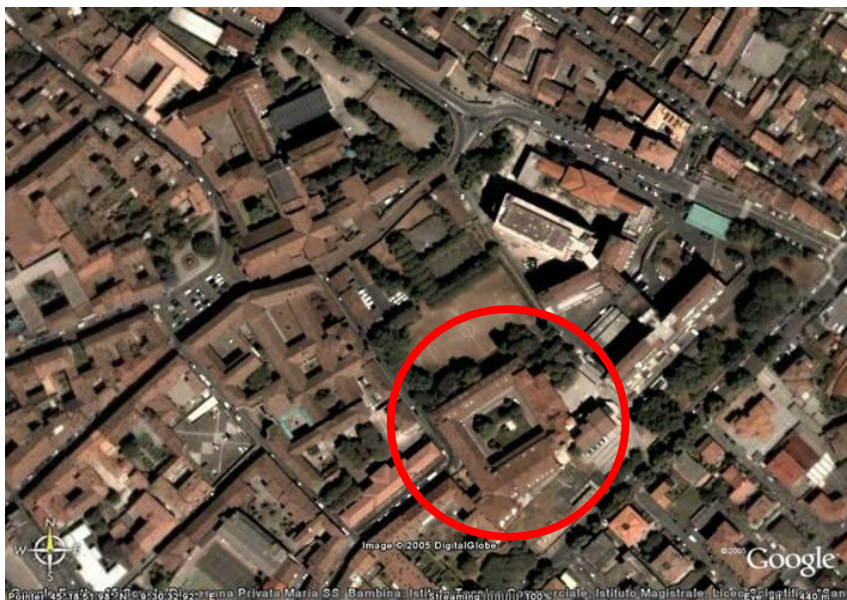
Fotografia aerea dell'area