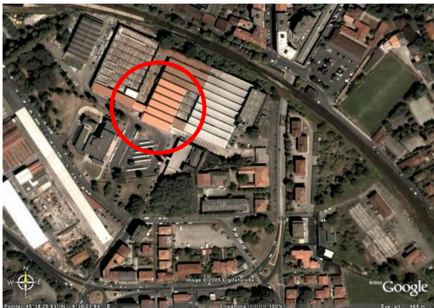
Fotografia aerea dell'area