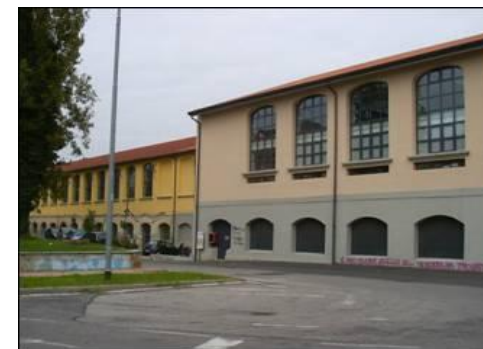
Foto edifici e/o posizione punti di misura

Altezza edificio: - m Numero piani esposti: 1 Numero finestre/ superficie finestre esposte: - Numero di persone esposte (abitanti/ utenti/ alunni/ posti letto) diurno: 51 - 100 Numero di persone esposte (abitanti/ utenti/ alunni/ posti letto) notturno: 0 Durata dell'esposizione (modalità di fruizione, continuità di presenza umana) diurna: 5 h (modalità di fruizione, continuità di presenza umana) notturna: 0 h