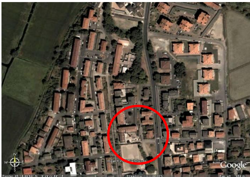
Fotografia aerea dell'area